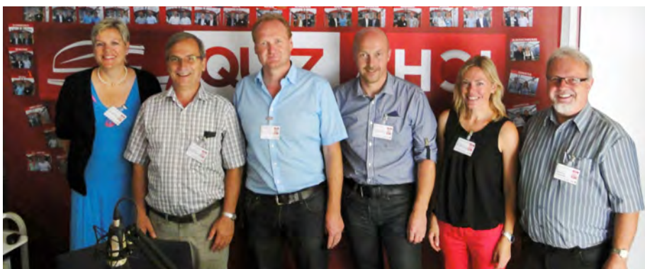
Die Teams aus Frastanz, Doren und Kennelbach