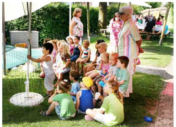
Gespanntes Warten auf den Kasperl.