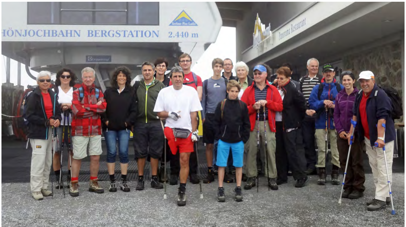
Das Wanderwochenende des Skiclubs Kennelbach war ein tolles Erlebnis.