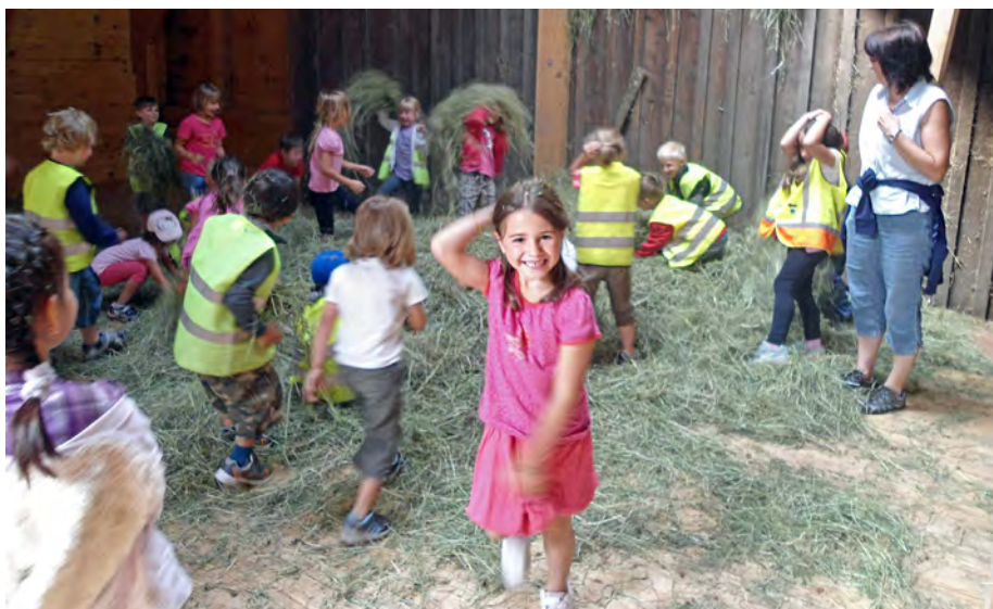
Auf dem Bauernhof haben die Kinder viel Spaß miteinander.

Die gemeinsame Erziehung von Kindern mit und ohne Einschränkung bietet Kindern in unserem Kindergarten die Möglichkeit, sich von klein auf in ihrer Verschiedenheit zu erfahren, sich