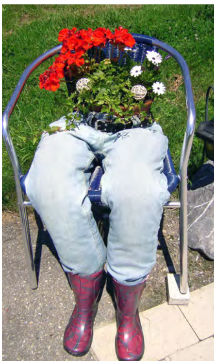
Kurioser Blumenschmuck nahe Hüttmannsberg