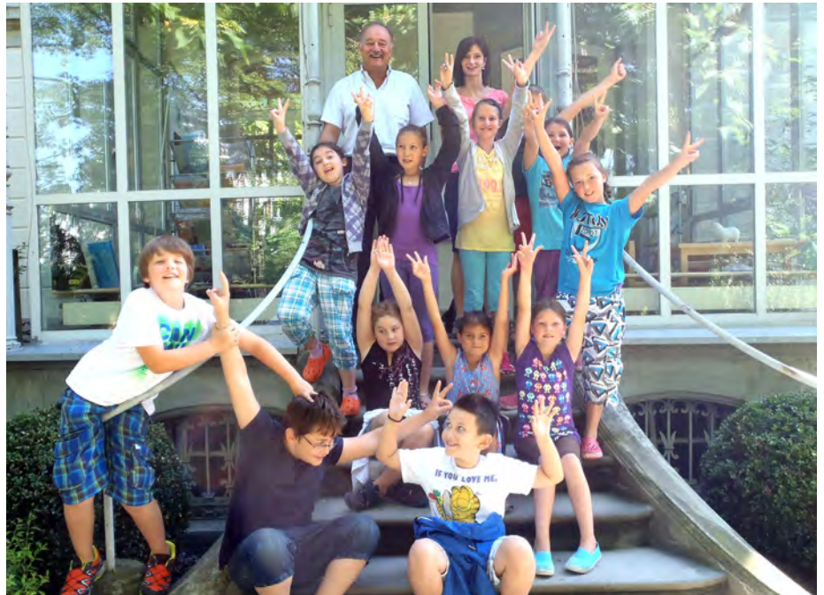
Die 3. Klasse mit Lehrerin und Bürgermeister

legenheiten wurden von den Schülerinnen und Schülern gestellt und die Antworten lebhaft diskutiert. Eine Jause