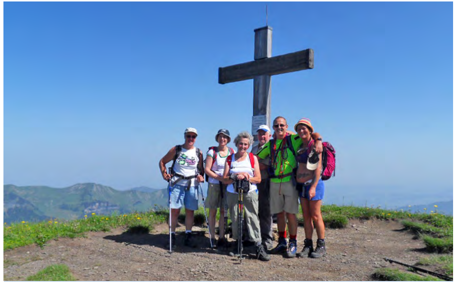
Bestes Wetter bei der Wanderung der Naturfreunde Kennelbach

Danach ging es planmäßig weiter zum Hochblanken (2068) und Ragazer Blanken (2051) bis zur Sünser Spitze. Von dort hinab zum Sünsersee, wo die Gruppe einen erfrischenden und genüsslichen Badaufenthalt mit Jause hatte. Vom sagenumwobenen Stier im Sünser See waren keine Spuren zu finden.