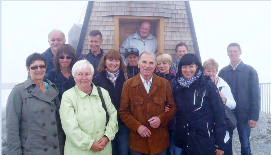
Gemeindebedienstete auf dem nebligen Säntis