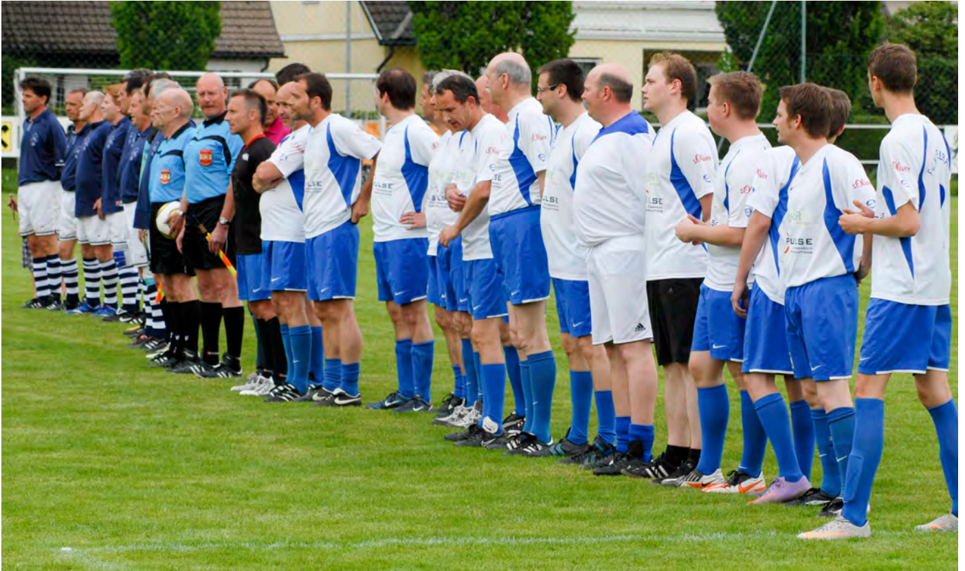
Die Prominententeams der beiden Vereine vor dem spannenden Spiel, das mit einem gerechten Unentschieden endete.