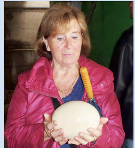
Nicht nur Gela staunte über die großen Straußeneier.