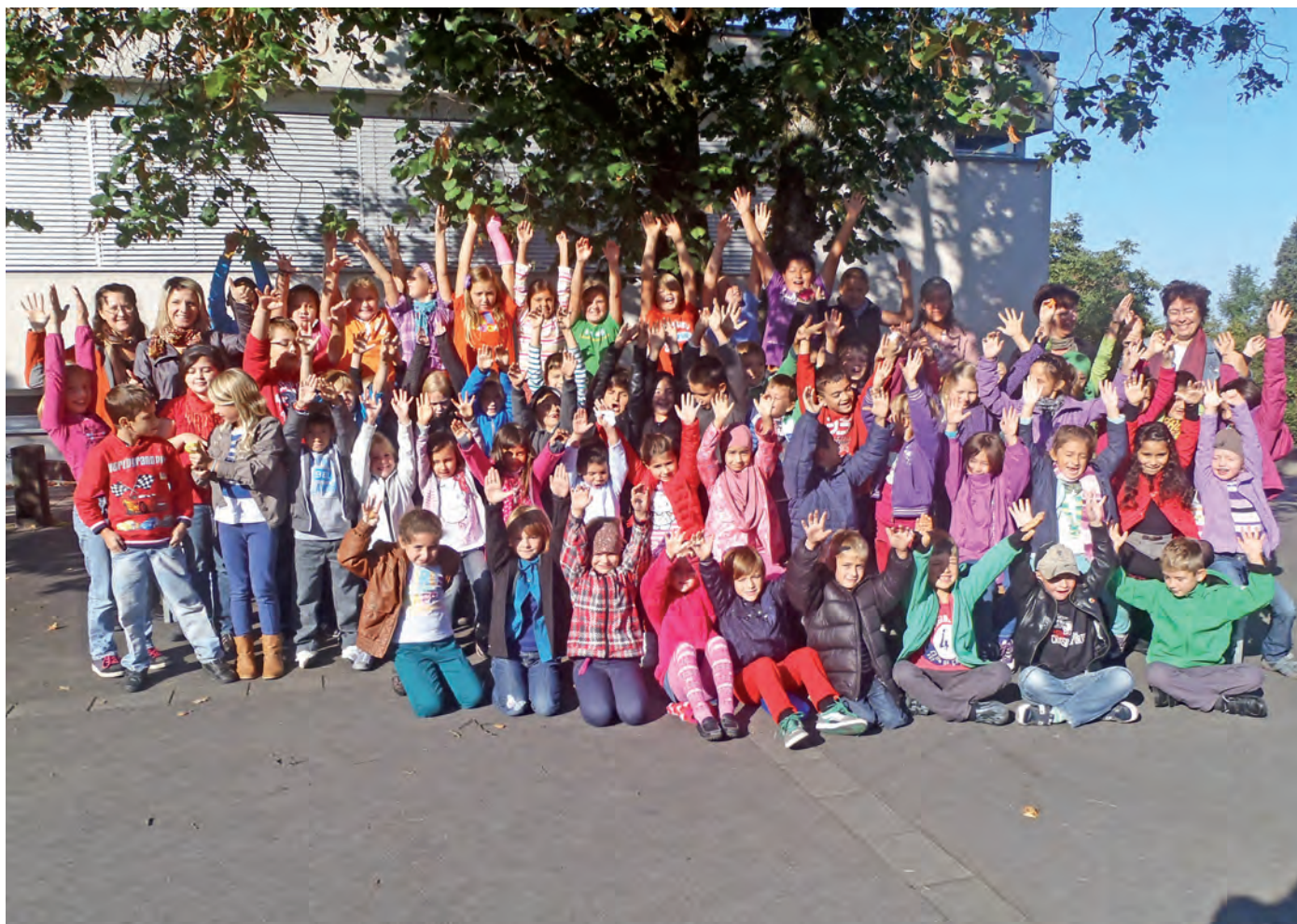
Die Kinder unserer Volksschule mit dem Lehrkörper. Im laufenden Schuljahr werden 64 Mädchen und Buben in vier Klassen von sechs Pädagoginnen betreut.