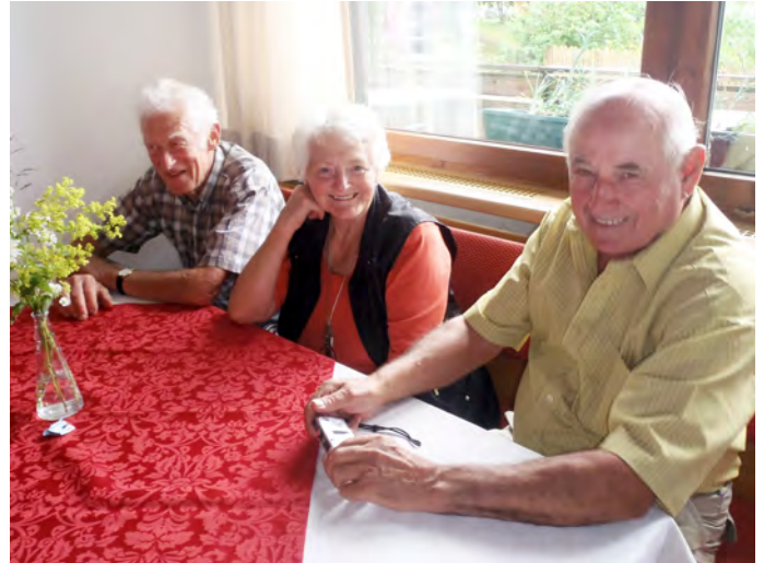
Beste Stimmung bei der Ausfahrt der Kennelbacher Seniorinnen und Senioren am 19. Juli 2012.