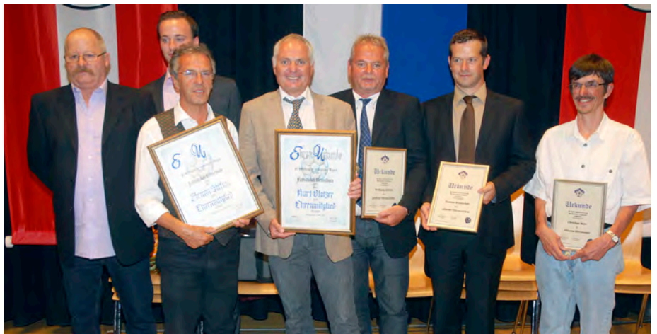
Die geehrten Mitglieder des FC Kennelbach.